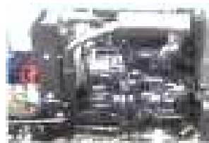
Mitsubishi Motor Stage V