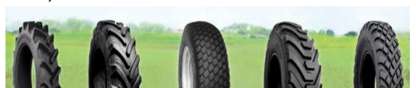
5 verschiedene Reifenprofile