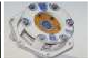
Bremsen in Ölbad